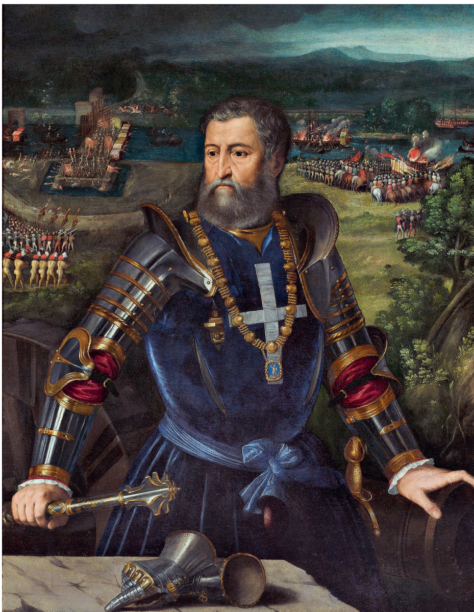
Obr. 1. Battista di Nicolò Luteri, řečený Battista Dossi, portrét Alfonsa I. d'Este, vévody z Ferrary, inv. č. 450, Ministero per Beni e le Attività Culturali, Gallerie Estensi.