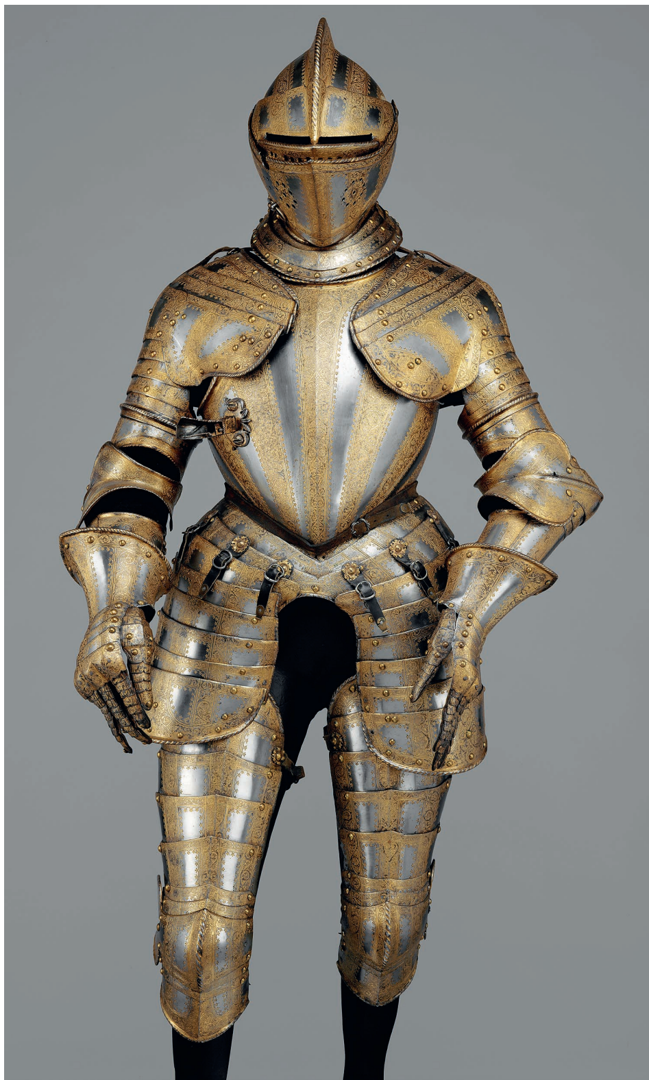
Obr. 5. Zbroj Alfonza II. d'Este, Itálie 1550–1560, inv. č. A 765. Kunsthistorisches Museum Wien, Hofjagd- und Rüstkammer.